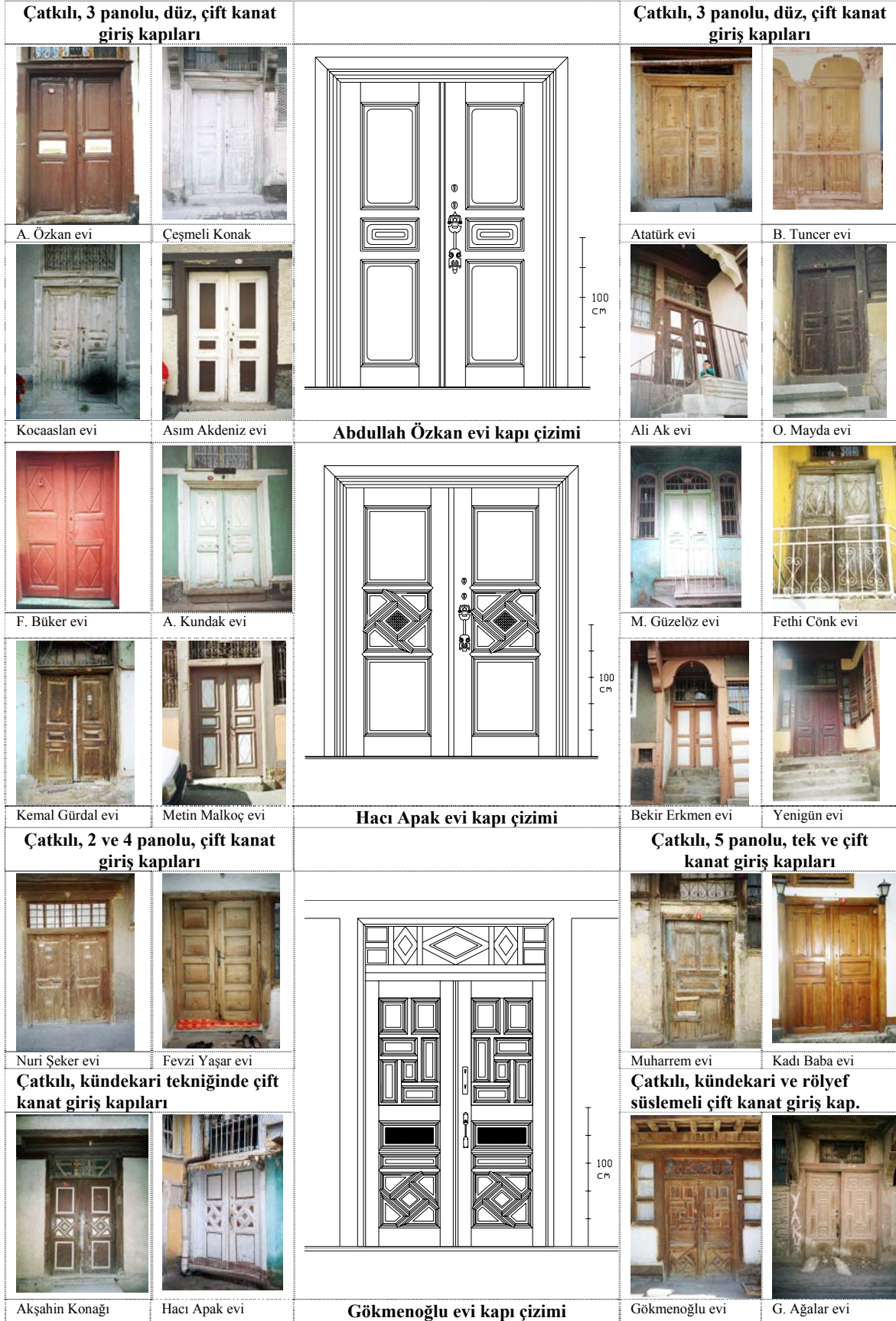
Şekil 3. İncelenen Afyonkarahisar evlerinin panolu ve süslemeli giriş kapısı örnekleri