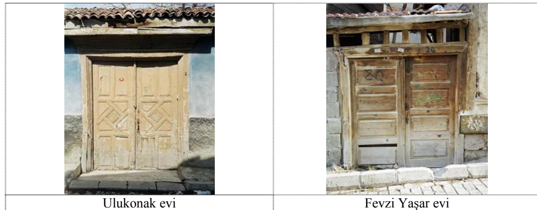
Şekil 2. Afyonkarahisar merkez ve Şuhut'ta yer alan iki adet avlu kapısı örneği