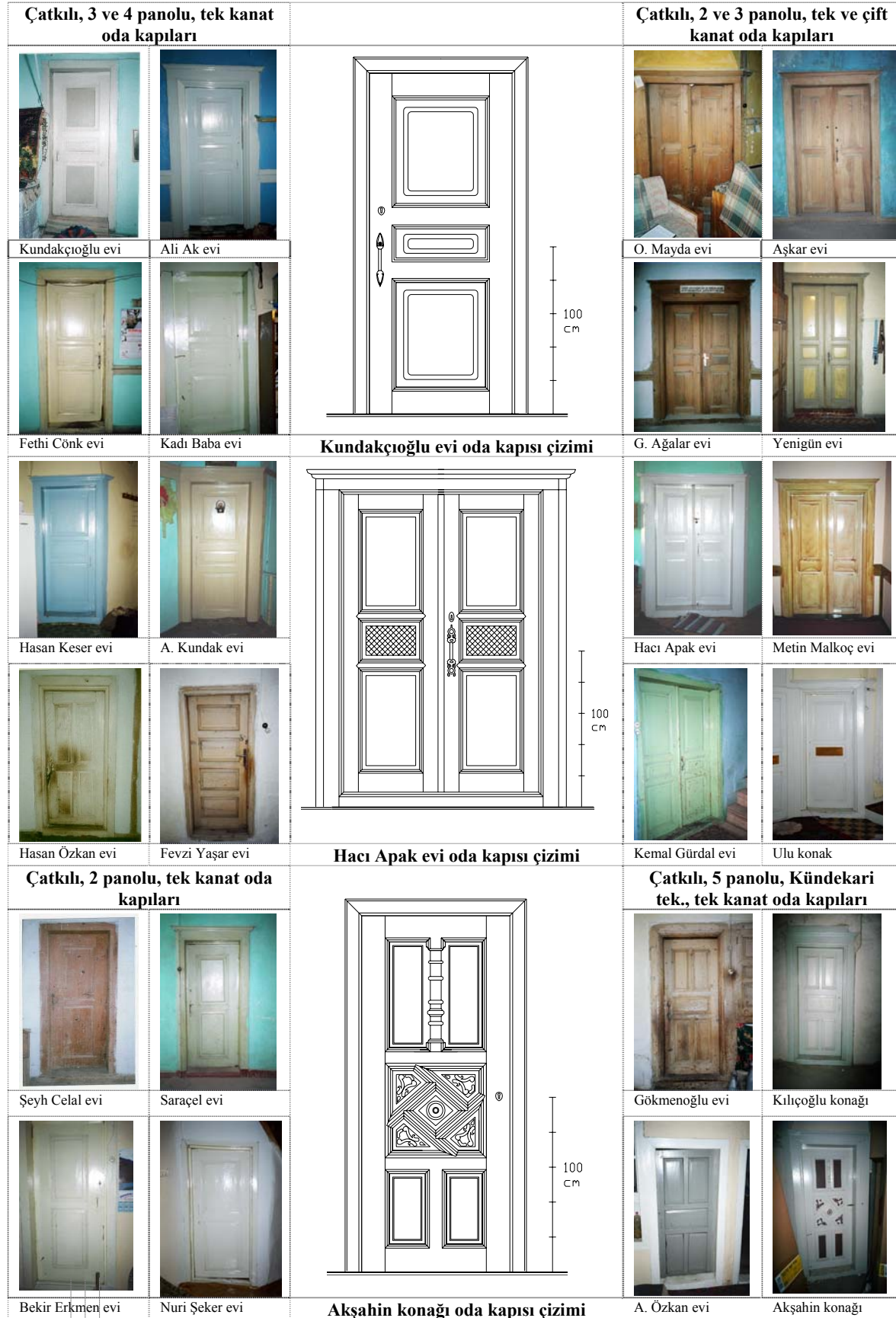
Şekil 4. İncelenen Afyonkarahisar evlerinin panolu ve süslemeli oda kapısı örnekleri