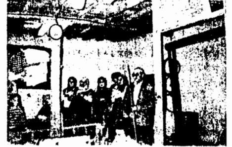
Elinde çubuğu ile ayakta duran gözcü. Yukarıdaki direkte Ehl-i Beytin tarihçesini gösteren tablo

desenleri işlenmiş. Kadınlar kısmının kapıya bitişik duvarlarında üç ayaklı 7 tane sofra ahtan ve yanlarında sofra bezleri duvara asılmış durmaktadır.