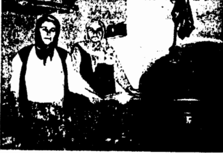
Lokma odasında aşure ve lokma pişiren bacılar

küçük bir odaya giriliyor. Burası hem kiler, hem lokma odası ve hem de kurban odası olarak kullanılıyor. Onun solundaki kapıdan törenlerin yapıldığı ve üç bölümlü geniş bir mekana giriliyor. Buraya erkan odası denilmesinin doğru olacağını düşünüyoruz. Ortada kırklar meydanı veya halka olarak adlandırılan bölüm yer alıyor. Halkanın sağında kadınlar musfası, solunda ise erkekler musfası bulunmaktadır. Bazı Aleviler buna kadınlar ve erkekler sofası adını veriyorlar.