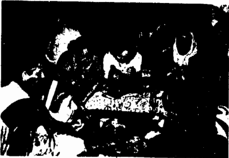
Aşure çorbası içen ve lokma yiyen bacılar

Önce dedenin ve halkadakerin, sonra kadın ve erkekler musafanın sofraları kuruldu ve dede yenecek duasını yaptı: "Bismi Şah Allah soframız dolu, halkamız ulu, yardımcımız Hütkar Hacı Bektaş Veli, Cumhuriyet Hükümetinin bakılığı için, gerçeğe Hü."