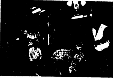
Kurbanların dualanıp, tekbirlenmesi, karşıda kadınlar sofasında darda duran bacılar

Dede, kurbanlar Muharem Kurbanıdır, dedi ve önce şu tekbir duasını yaptı: "Ferman-ı Celil, Kurban-ı Halil, Can-ı İsmail, Delil-i Cibrail, niyet, niyet, azaneti Tekba-ra" Burada cemaat üç defa tekbir getirdi ve dede şu duayı yaptı: "Kurbanlar kabul olsun, kazançlar gur olsun, Hz. Hüseyin'in nihi şad olsun, Cenabı Allah sağlara uzun ömür ve hayırlı kazançlar ihsan etsin ve Ehl-i Bey-tin yolunda yemek yedirmek nasip etsin" Böylece kurbanlar dualanmış ve tekbirlenmiş oldu ve kurbanlara su içirildi. Zakir, üç düazımam çalıp söylemeye başladı (Alevilikte, Hz. Muhammed ve Ehl-i Beytinden söz eden şiirlere, düazımam denilir) Bu sırada erkekler ki dizlen üzerine otururlarken bacılar ayakta darda durdular