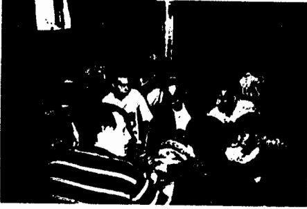
Kırklar meydanında aşure çorbası içen ve lokma yiyen erenler

Tören bitliği için sıra lokma yenilmesine geldi ilk önce dedenin sofrasının serilmesi gerekiyor. Bu maksatla sofracı, önce dedeye niyaz etti, sonra içinde ekme, çatal ve kaşıkların bulunduğu tepsiyi dedenin önüne koydu ve şunları söyledi: "Erenler Hü Bismi Şah Allah Allah diyelim, kadim Allah diyelim. Geldi Ali sofrası, içinde erenler lokması, gaziler Şah diyelim, Şah versin, biz yiyeceğiz, erenler demine Hü"