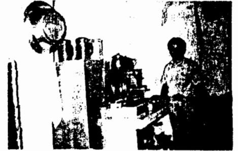
Genesinde çayocağı ve çaycı

Erkekler sofasında birinde kadın deseni bulunan 2 halı, onun üzerinde saat bulunmaktadır. Erkekler musfasının kapıya bitişik duvarlarında bir çay ocağı ve içme suyu bidonları yer almaktadır. ocaktan köz almakta kullanılan kürek, kapının yanında duvara asılı duruyor.