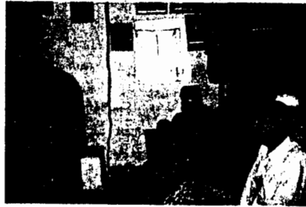
Fesi ve Cübbesi ile Dede