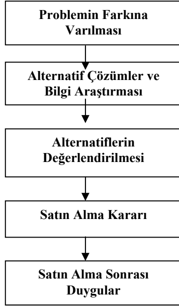
Şekil 2. Tüketici Satın Alma Karar Süreci

Kaynak: Kotler Philip; Marketing Management, 9. baskı, 1997, s.192.